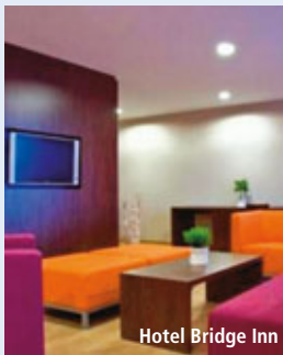
Hotel Bridge Inn