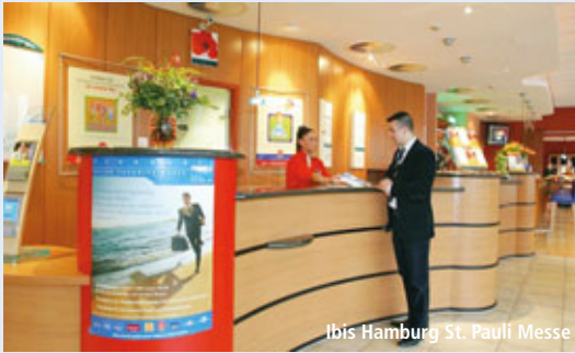
Ibis Hamburg St. Pauli Messe