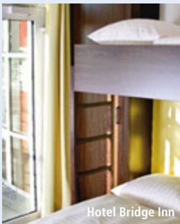
Hotel Bridge Inn