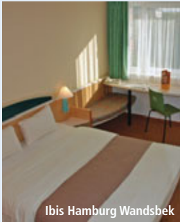
Ibis Hamburg Wandsbek