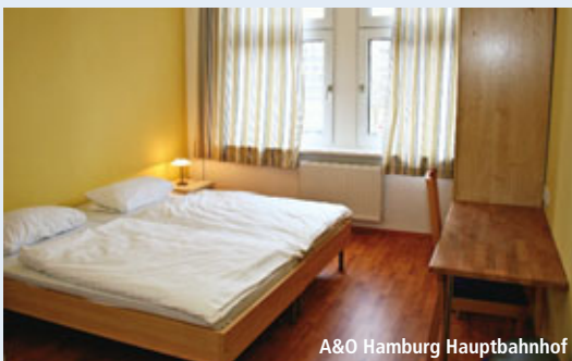
A&O Hamburg Hauptbahnhof