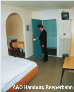
A&O Hamburg Reeperbahn